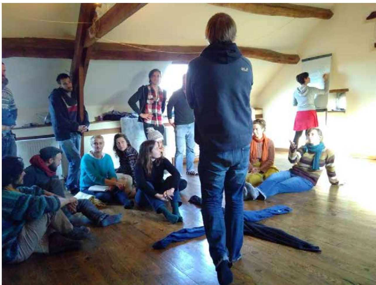
Mise au vert 2019

Ces deux thématiques sont traitées indépendamment, mais elles sont également dans la continuité l'une de l'autre. En effet, nous travaillons sur la mise en réflexion des personnes sur ce qu'elles mangent (qualité des aliments, modes de production, santé, environnement, liens entre les intervenants, enjeux de l'alimentation dans le monde...), mais nous nous penchons également sur le contexte de vie de notre public, c'est-à-dire la ville, et les alternatives que les personnes peuvent mettre elles-mêmes en place dans ce contexte particulier (produire soi-même, s'approvisionner auprès d'initiatives locales et respectueuses, question du prix juste, de la solidarité...).